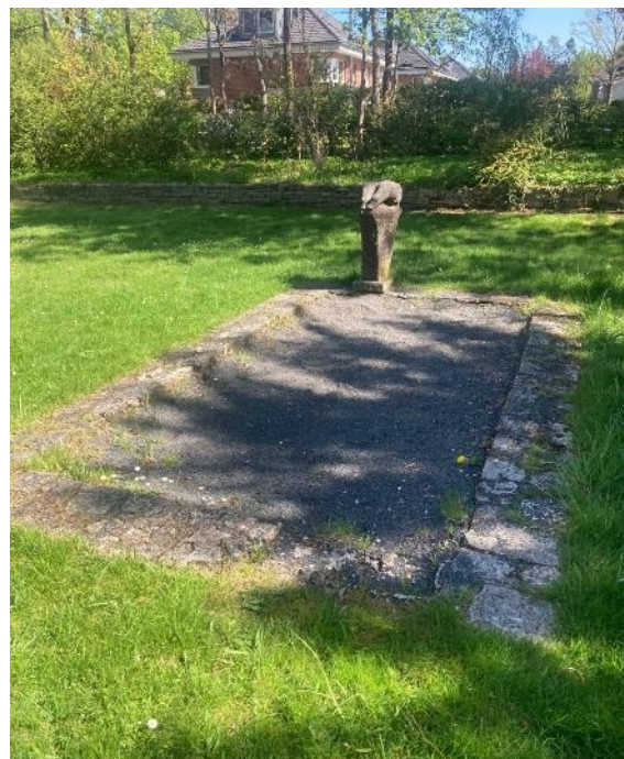
Relikte älterer Gestaltungen, Konzer Platz

Bei Interesse mitzumachen, bitte melden: walther@buergerverein-frohnau.de