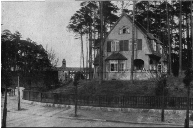
Haus Ihmsen von Poser, im Hintergrund die Fürstendammbrücke von Straumer (BWA 1917, S. 37)

Im Jahr 2026 können wir die 150. Geburtstage von zwei der bedeutendsten Architekten Frohnaus begehen: Heinrich Straumer und Paul Poser wurden beide im Jahr 1876 geboren. Dutzende Landhäuser, aber auch Siedlungen, Geschäftshäuser und Funktionsbauten stammen von den beiden Baumeistern, die das Bild der Gartenstadt bis heute nachhaltig prägen. Bisher sind Berlinweit noch keine geplanten Würdigungen der Architekten