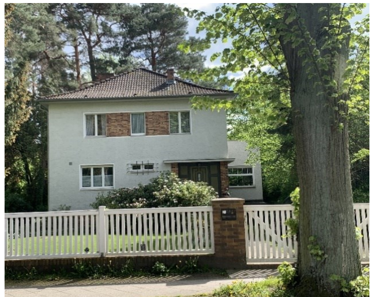
Abb.: Typisches Haus um 1930