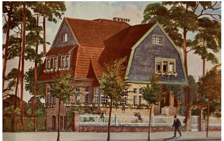
Abb.: „Projektiertes Landhaus“ als Beispiel aus Werbebroschüre

Nach einem langen Diskussionsprozess von Bezirksamt, Denkmalpflege, Bürgerinnen und Bürgern sowie Vereinen wurde schließlich 1997 eine Erhaltungsverordnung aufgestellt und 2006 wurden Bebauungspläne für ganz Frohnau festgesetzt, die die Bebaubarkeit wieder im Sinne der ursprünglichen Planungsidee neu regulierten bzw. im Lichte neuer Anforderungen weiterentwickelten.