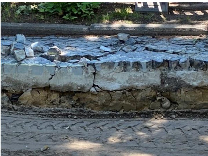
Abb.: Betondecke unter dem Pflaster. Mittlerweile ist das Pflaster bis über die Höhe Markgrafenstraße vollständig entfernt