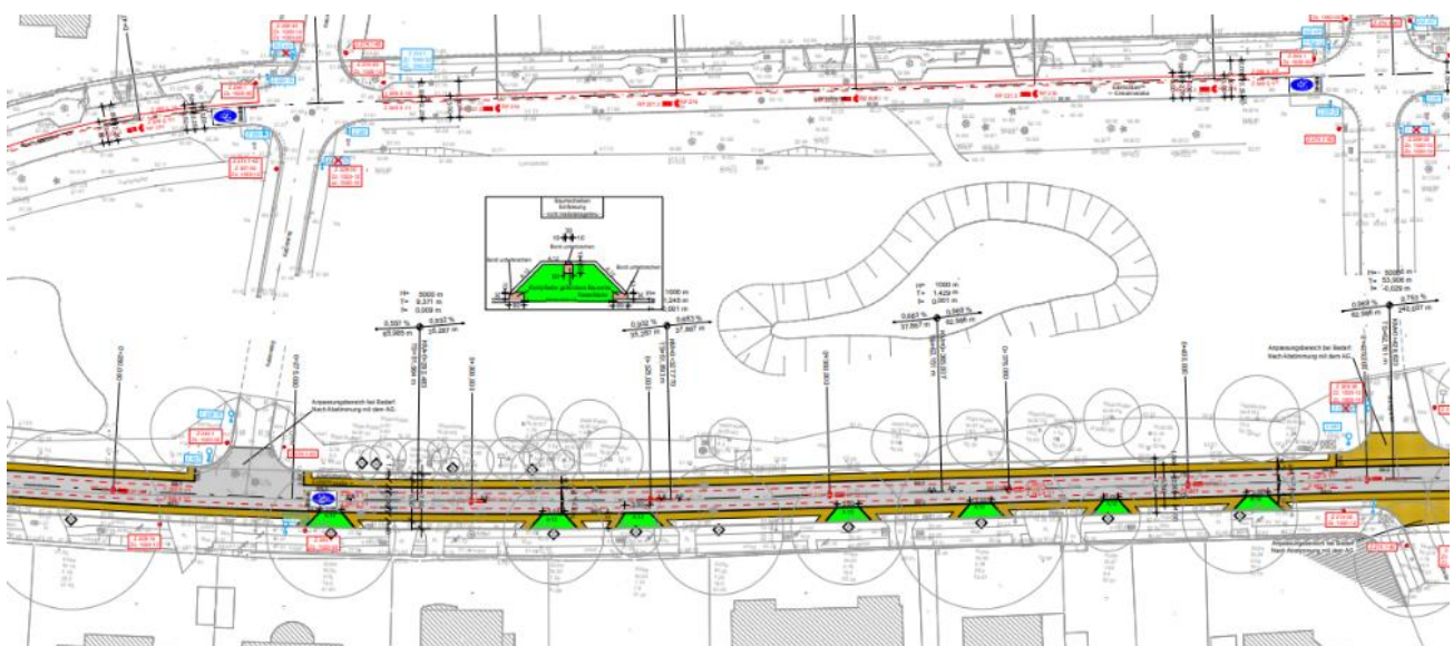
Abb.: Detailzeichnung zwischen Katzensteg und Markgrafen. Erkennbar sind die erweiterten Baumscheiben sowie die noch fehlenden Zuflüsse zum Mittelstreifen

Zudem werden die Baumscheiben auf der Südfahrbahn des westlichen Edelhofdamms vergrößert, wodurch vor einigen Bäumen nicht mehr geparkt werden kann. Zusätzlich zur Verbesserung des Baumschutzes will das Bezirksamts durch spezielle Zuflüsse zu den