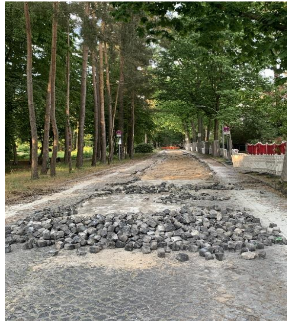
Abb.: Baumaßnahmen

Nun ist eine Fahrradstraße im Richtungsverkehr auf beiden Seiten der Grünfläche (Brix-Genzmer-Park) vorgesehen. Das jetzige Einbahnstraßensystem für Auto und Rad wird damit beibehalten. Nach der Baumaßnahme dürfen durch das Zusatzschild „Anlieger frei“ alle Anwohnenden und deren Gäste, Handwerker, Lieferanten, Dienstleister, Versorger und Besucher von Einrichtungen wie dem Buddhistischen Haus sowie Nutzer des Restaurants und anderer Gewerbebetriebe die Fahrradstraße weiterhin befahren und Fahrzeuge abstellen.